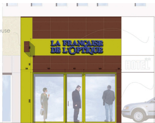
enseigne: lettres bleues rétro-éclairées