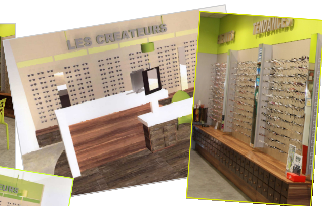
Espaces pour les montures « Créateurs », « Tendances,...